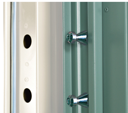
Tapper med mothaker i bakkant og hengsler med sikrede splinter øker sikkerheten.