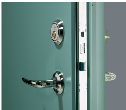
Flerpunktslås med skåter oppe og nede.