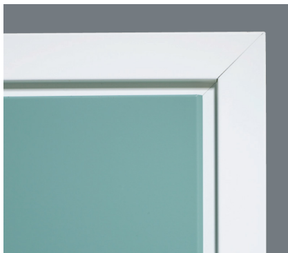
Overfalsen med skråstilt kant gir et moderne og gjennomført inntrykk.