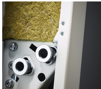
Karmhylser sørger for rask og sikker montering.