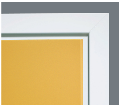
Overfalsen med skråstilt kant gir et moderne og gjennomført inntrykk.