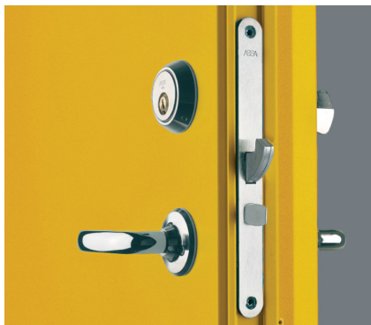
Låskassen Assa 510.