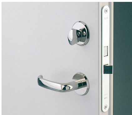
Låskassen Assa 565.