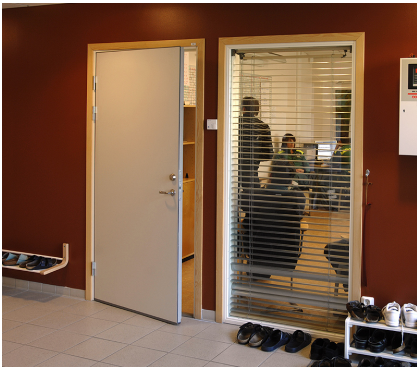
Lyddører 43dB benyttes som regel i møterom