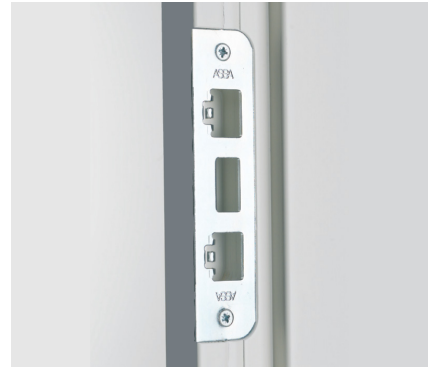
Sluttstykke for låskassen