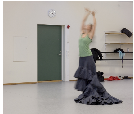
Daloc lyddør brukt ved dansehøgskolen