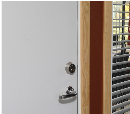
Dørbladet er utstyrt med en ekstra tetningslist