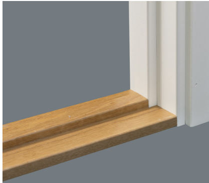
Terskel av hardved.