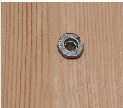
Karmen utstyres med montert karmhylse fra fabrikk.